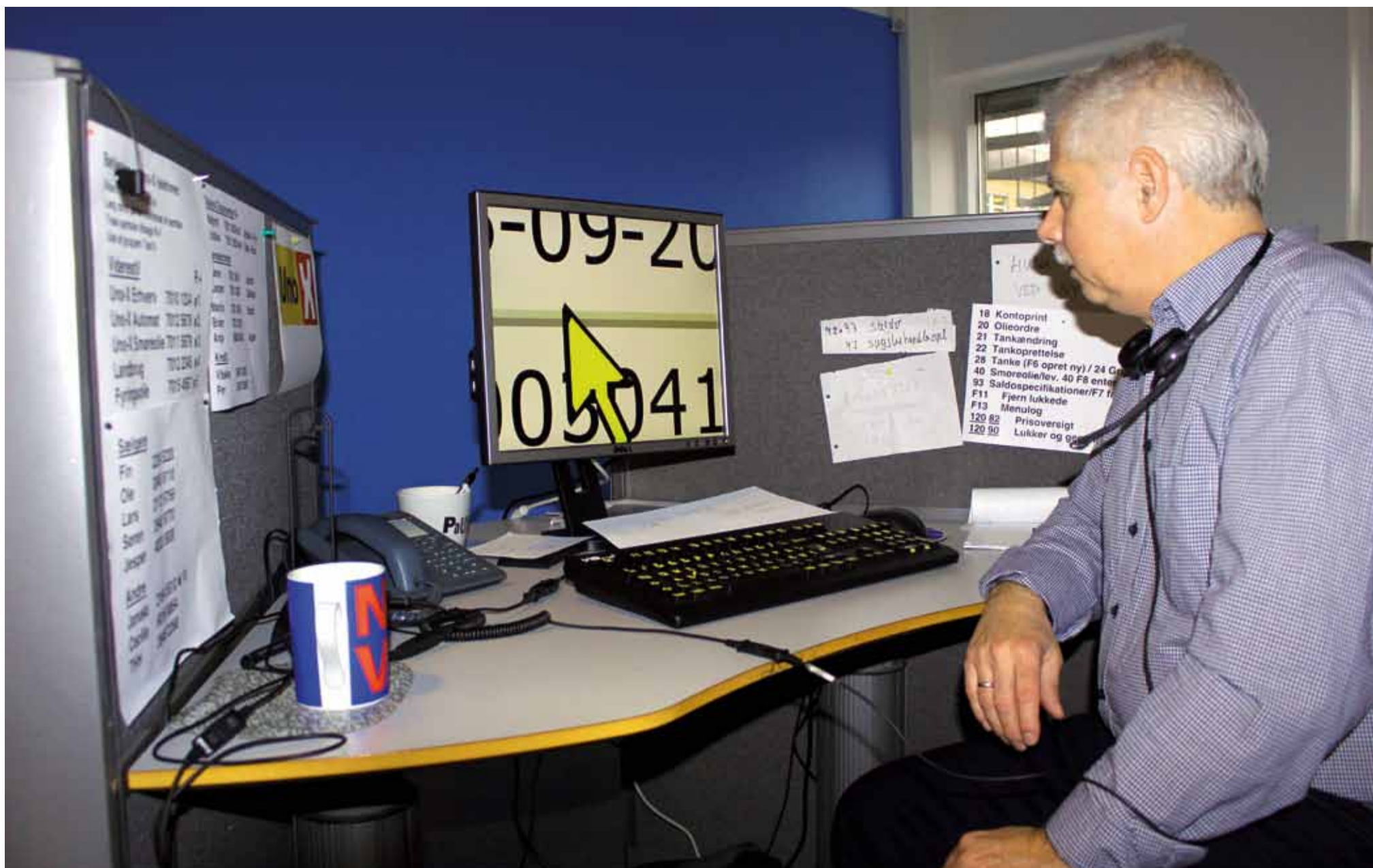
Programmet ZoomText er et af de hjælpemidler, de ansatte i den socialøkonomiske virksomhed Telehandelshuset bruger. Det kan forstørre teksten op til 36 gange.