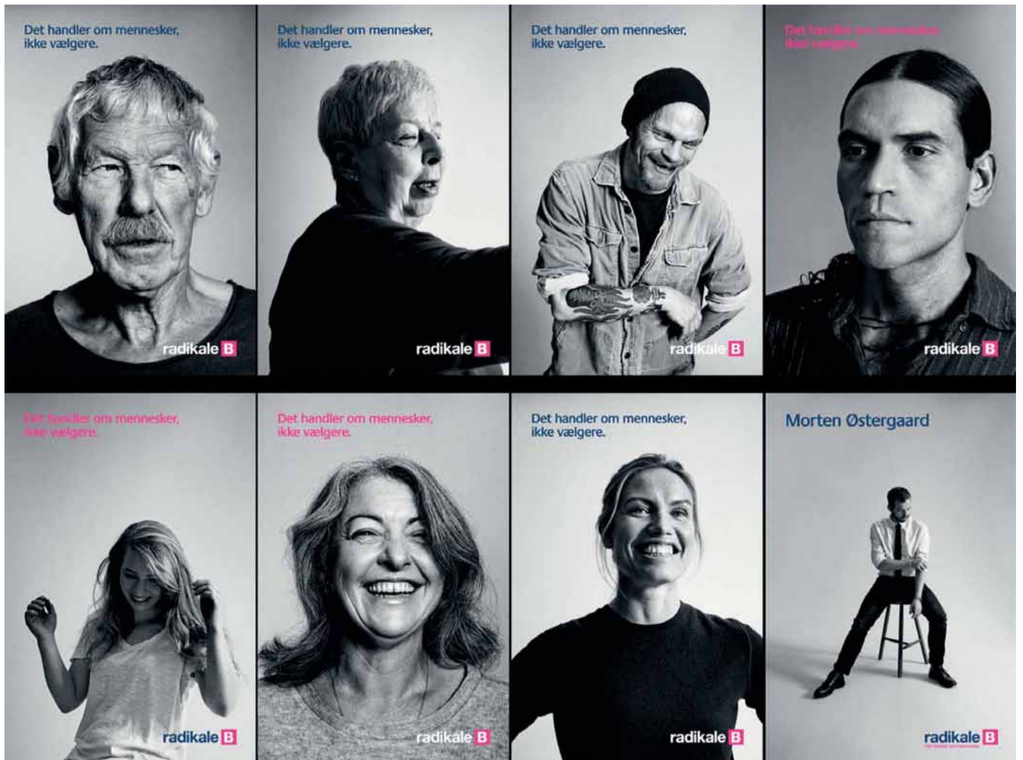
Radikale Venstres nye kampagneplakater har gennem november præget bybilledet i store dele af landet.